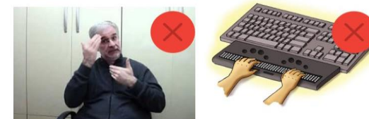
*Falta de Libras em vídeos na internet.