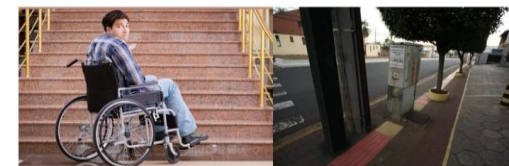
*Falta de rampas.