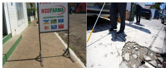
*Propaganda na calçada.