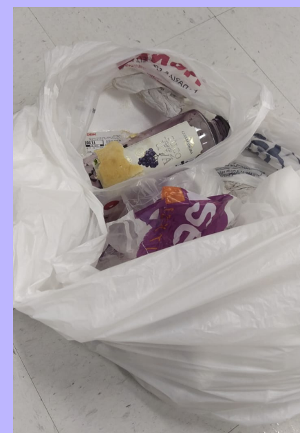
Lixo infectante contendo embalagens, restos de alimentos e frasco de suco.

Notificamos recorrentemente situações de descarte incorreto de resíduos na Ceis. O descarte inadequado traz custos para a Universidade, além de trazer riscos para a saúde de todos e do meio ambiente.